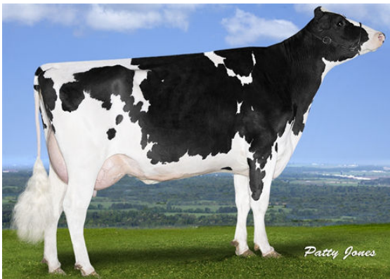
PROGENESIS ENFORCER PAT FIFTH DAM